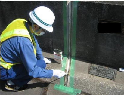
コンクリート面等付着面にプライマー-Uを原液にて塗布する。（塗布量 0.1～0.2kg/m 2 目安）