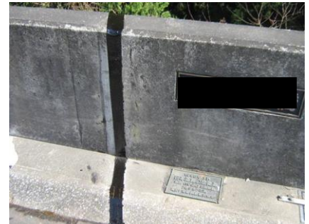
スカイシール F-2 充填施工完了。