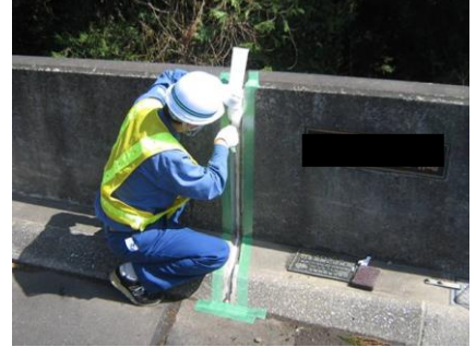
軟質ウレタン材等を遊間部に挿入。シール深さが一定になるように位置を決定し固定する。