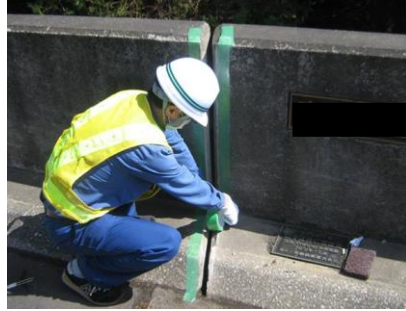
養生テープにてシール塗布部の際を養生する。 （写真では研磨ブラシで塗布面の下地調整も行った）