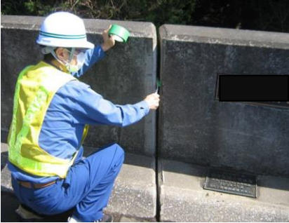
既存目地材を撤去し、ワイヤブラシ等でゴミ・埃を除去清掃を行う。